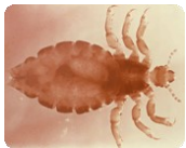
Los piojos adultos son de 2.1–3.3 mm de longitud

La eliminación completa de liendres es importante para verificar el éxito del tratamiento contra los piojos.