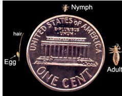
Tamaño real de las tres formas de piojos en comparación con un centavo.

Los piojos son insectos muy pequeños llamados parásitos que pueden infestar el cabello de la cabeza humana. Estos insectos salen de pequeños huevos (llamados liendres) que se adhieren a la base de los pelos individuales en la cabeza. Por lo general, los huevos tardan unos 10 días en eclosionar y la madurez se produce aproximadamente 2 semanas después.